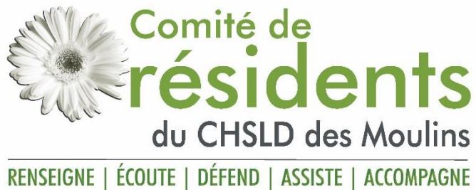
Image du comité de résidents